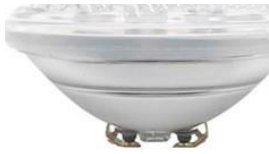
Niche fixture (δεν περιλαμβάνεται)